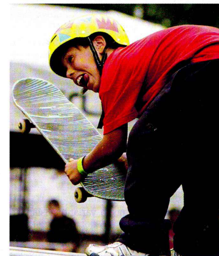
Mazs cinitis... Jaunākais sacensību dalībnieks Mikrobs spēja gāzt dažu lielu vezumu