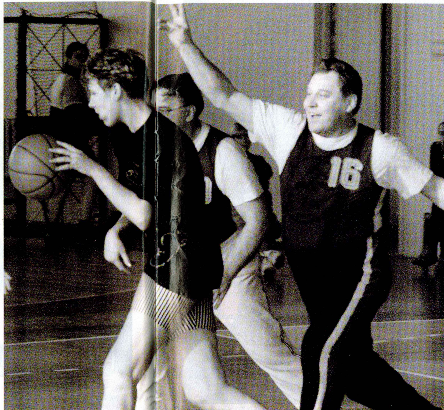
Rektors pret studentiem. Epizode no LSPA meistarsacīkšu kārtējās spēles

“Trīs gadus mācījos Vissavienības zinātniski pētnieciskā fiziskās kultūras institūta aspirantūrā Maskavā. Mana zinātnu kandidāta disertācija bija par to, kādām jābūt treniņu slodzēm, lai tās jauno basketbolistu augšanu garumā nevis aizkavētu, bet gan stimulētu. Šis darbs ļoti ieinteresēja japāņus, bet dzelzs priekšskars jebkādas sadarbības sarunas padarīja neiespējamā. Par profesoru esmu kļuvis divkārt — gan padomju laikos, gan tagad.