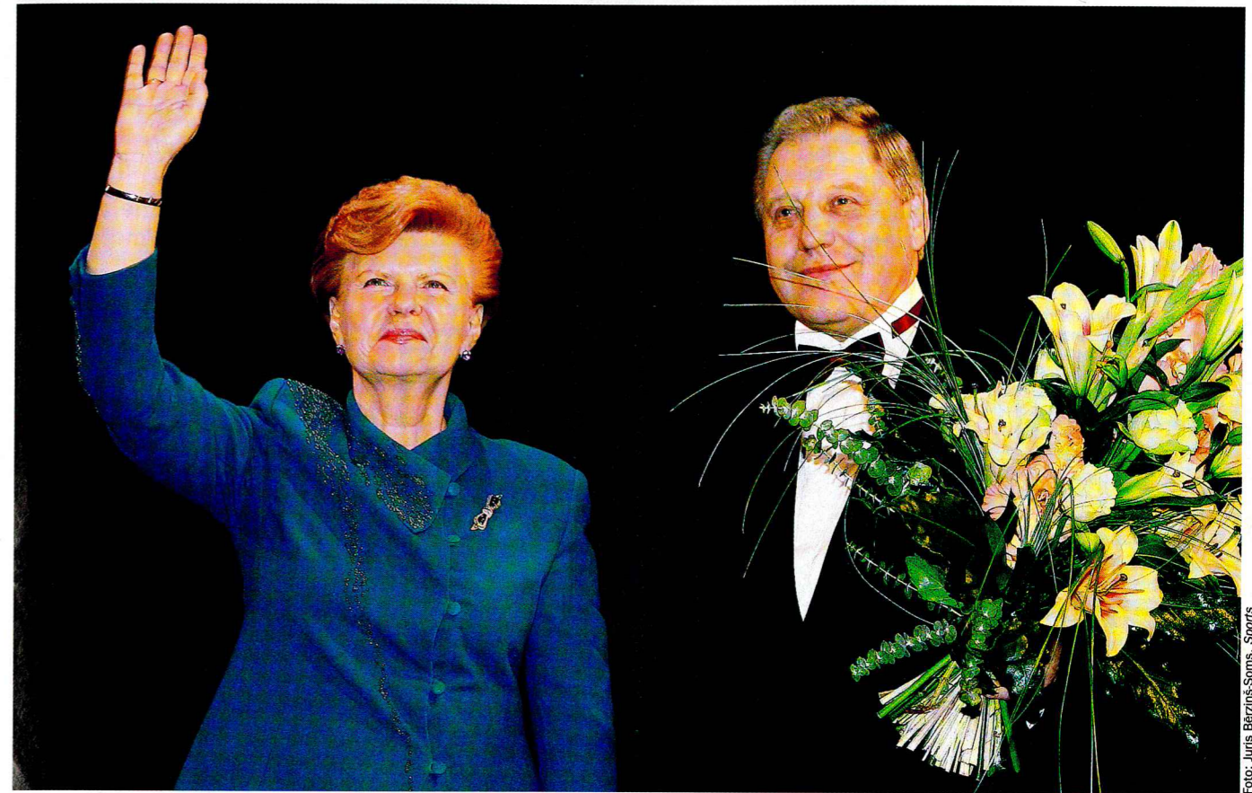
Mēs esam lieli. Ar sportiski valstisku sveicenu svētku dalībniekus sumina Valsts prezidente Vaira Vīķe-Freiberga

■ LSPA absolvējis 7051 sporta skolotājs, 1247 dažādu sporta veidu treneri, 992 fiziskās kultūras instruktori civilajā aizsardzībā, 305 izglītības un sporta menedžeri, 161 fizioterapeiti, 135 veselības mācības skolotāji, 85 anatomijas un fizioloģijas skolotāji, 79 masieri, 40 tūrisma menedžeri, 13 bioloģijas skolotāji, 5 militārās mācības skolotāji